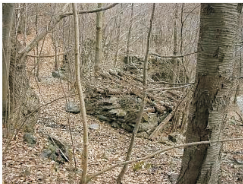
RUDERI MAPPALI 59 E 60