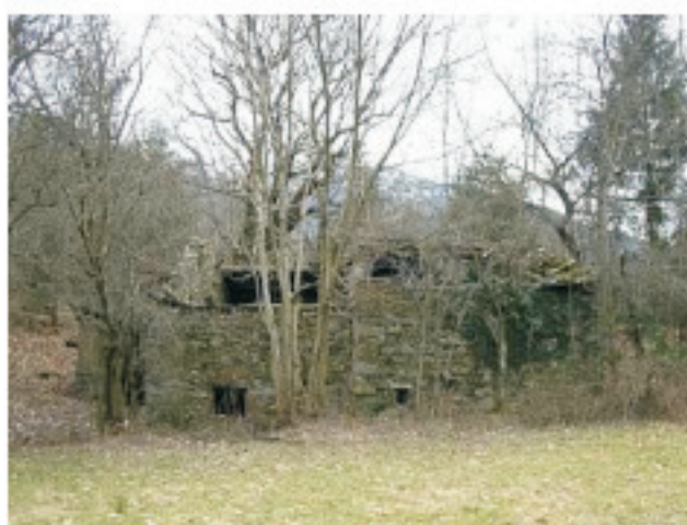
PROSPETTO NORD FABBRICATI MAPPALI 43 E 44