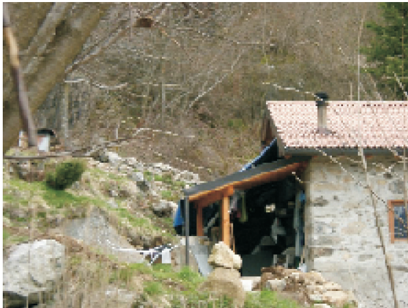
PROSPETTO NORD OVEST