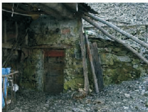
CASELLO DEL LATTE POSTO SOTTO LA TETTOIA