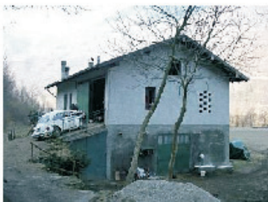
PROSPETTO NORD EST