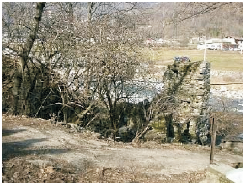
FOTO DEL RUDERE