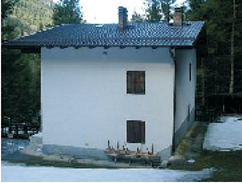
PROSPETTO NORD EST