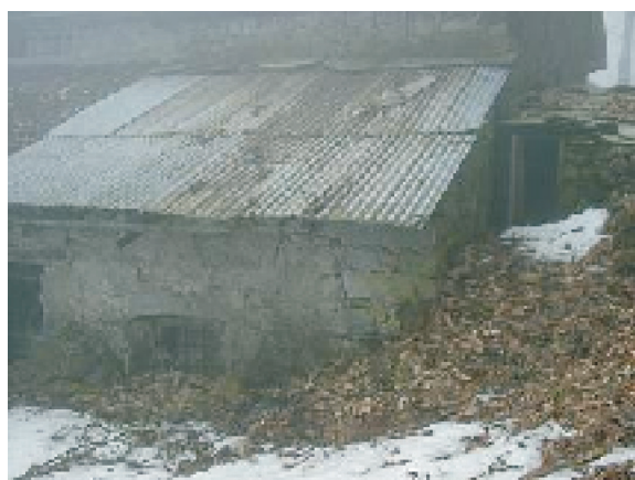
PROSPETTO SUD OVEST