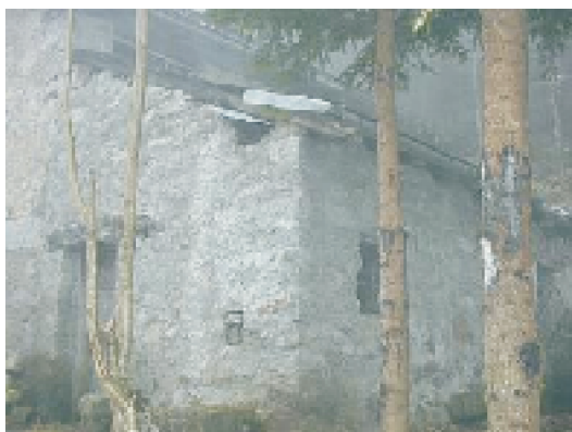
PROSPETTO NORD OVEST