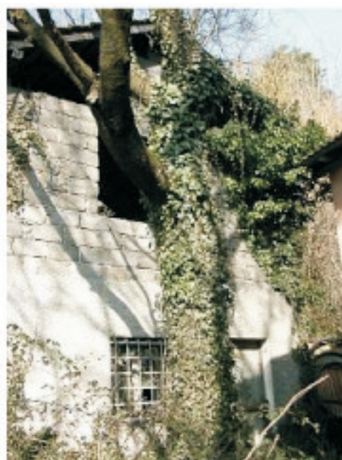
PROSPETTO SUD EST