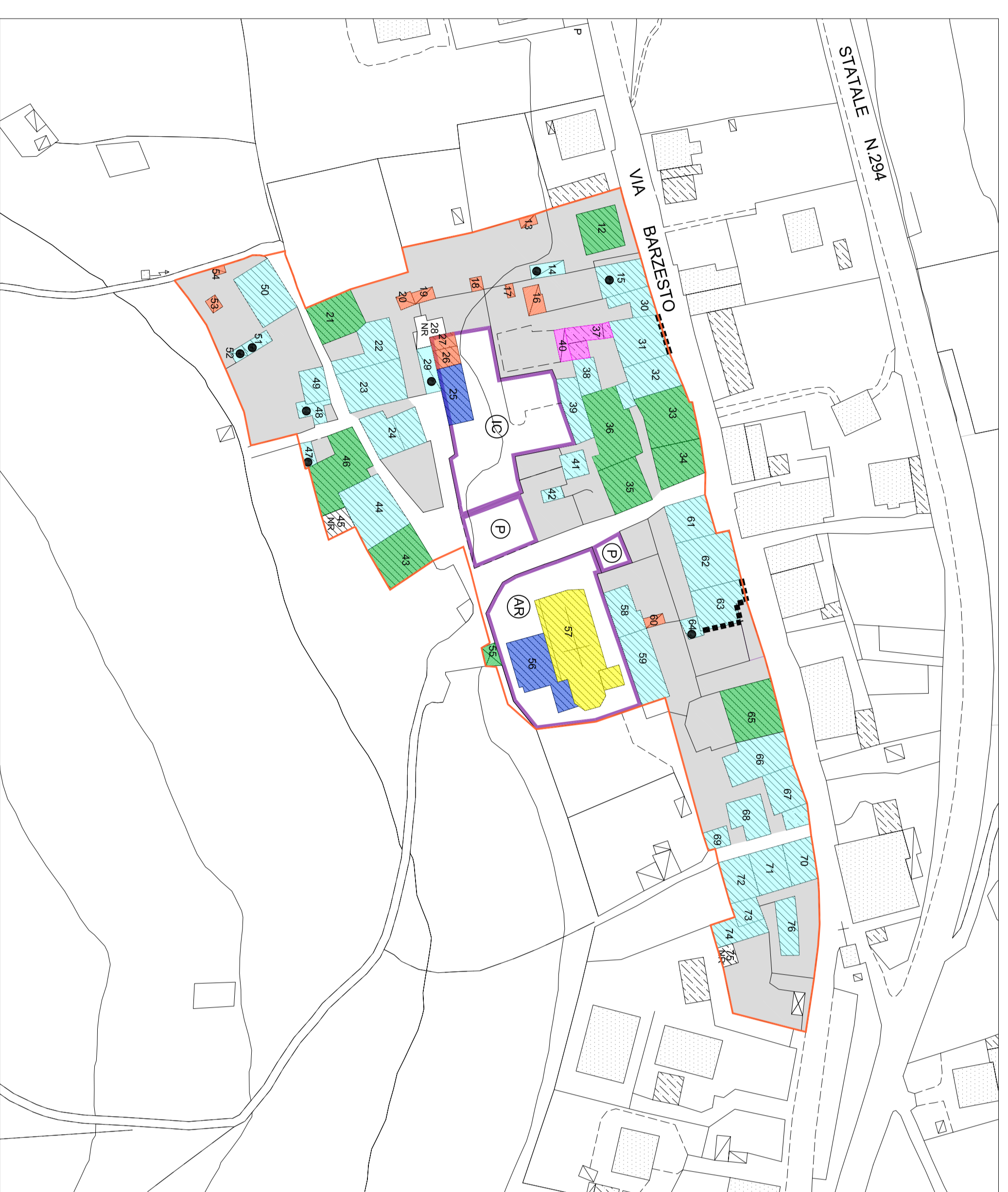
C. CENTRO STORICO DI RONCO