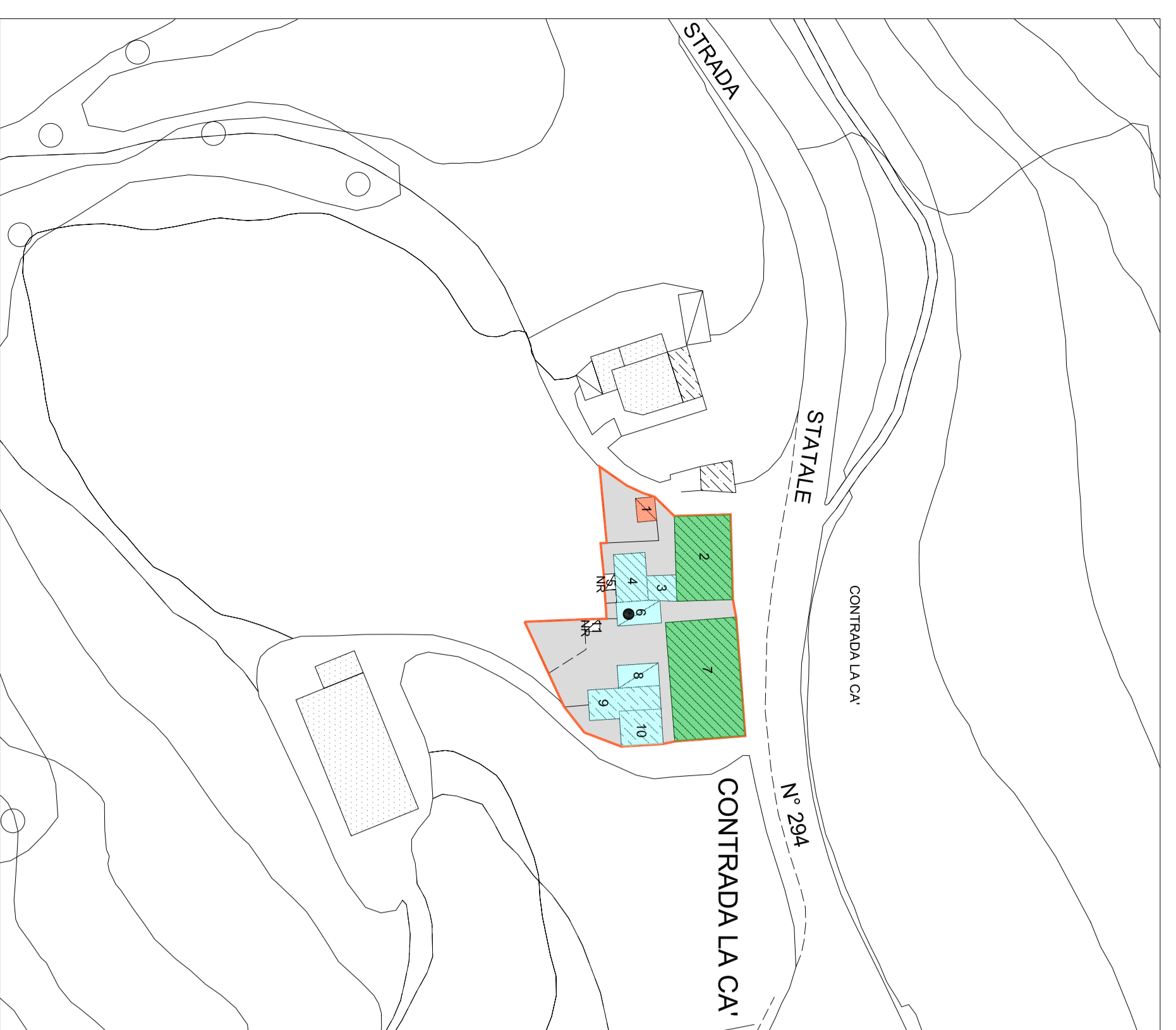
B. CENTRO STORICO DI BARZESTO