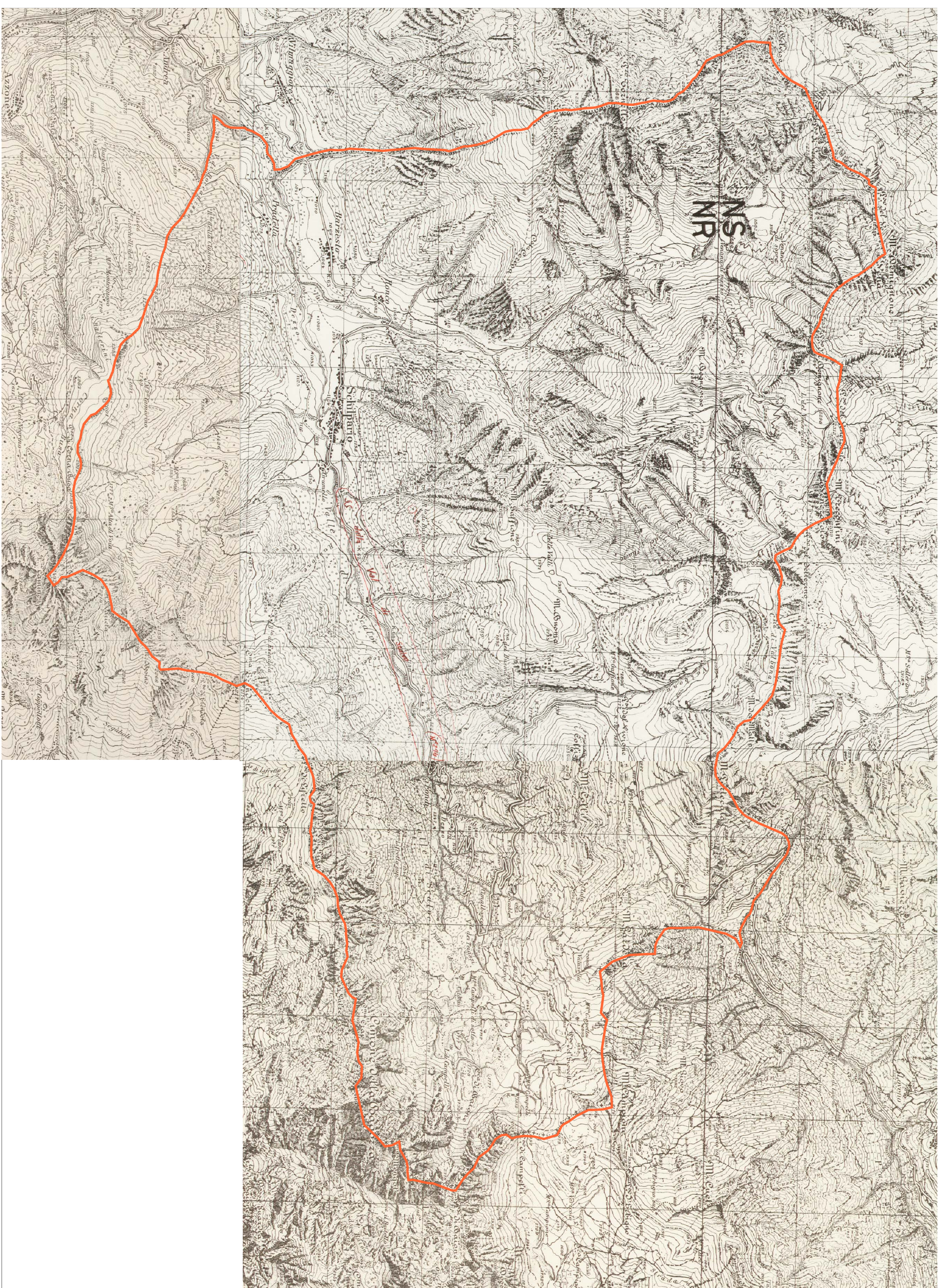
Rilievo del 1934