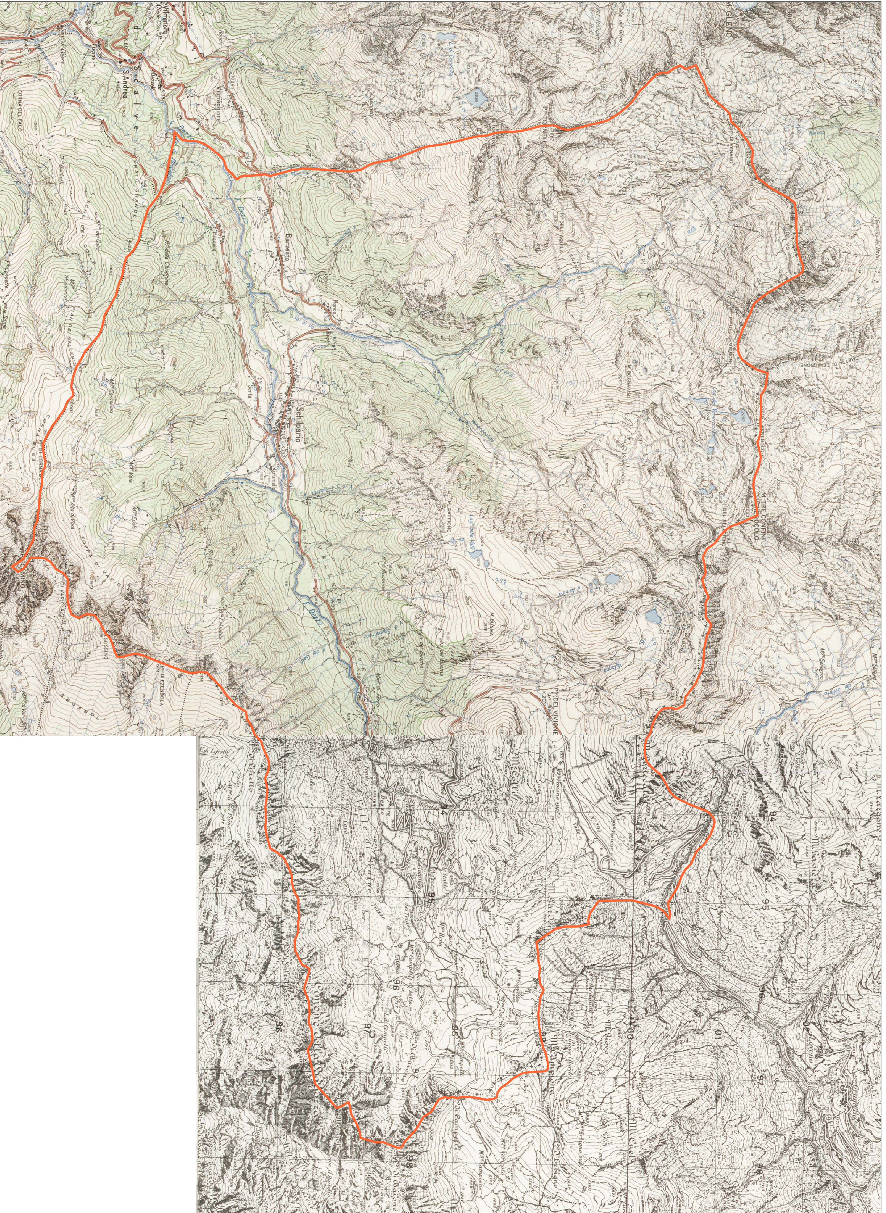
Rilievo del 1962