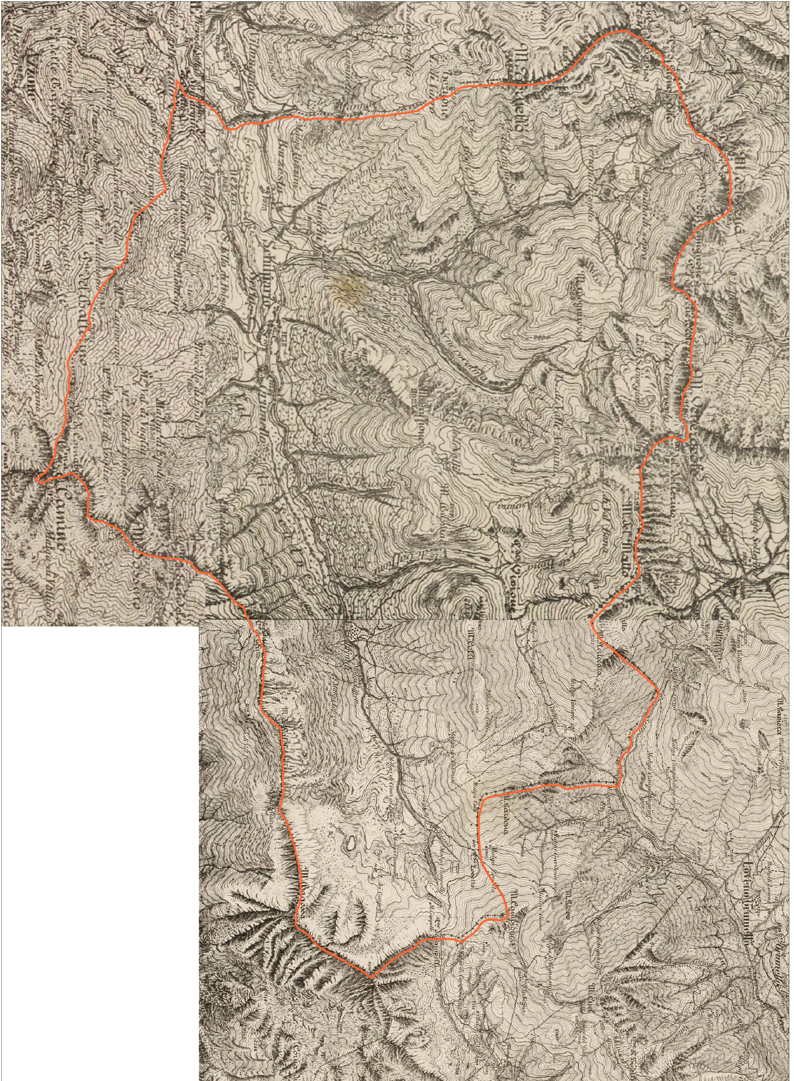
Levata nel 1885