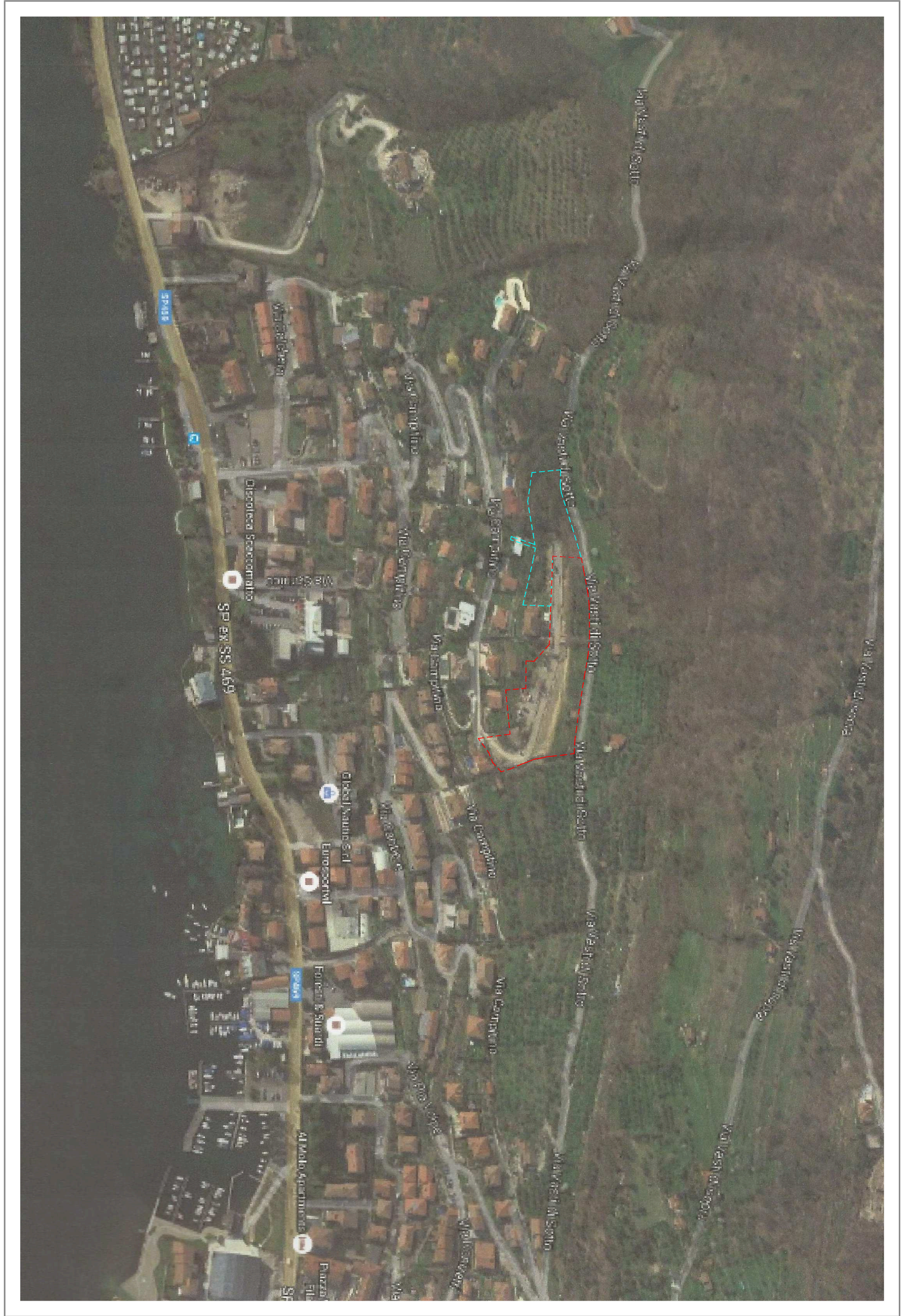
ORTOFOTO Prodotto nel 2005/2004 da B.T.E. in scala 1:2000 Prodotto nel 2005/2004 da B.T.E. in scala 1:2000 Prodotto nel 2005/2004 da B.T.E. in scala 1:2000