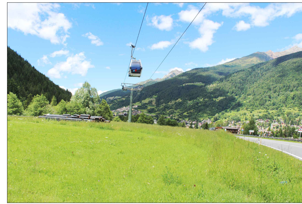
06_ vista dal centro dell'AdT_6