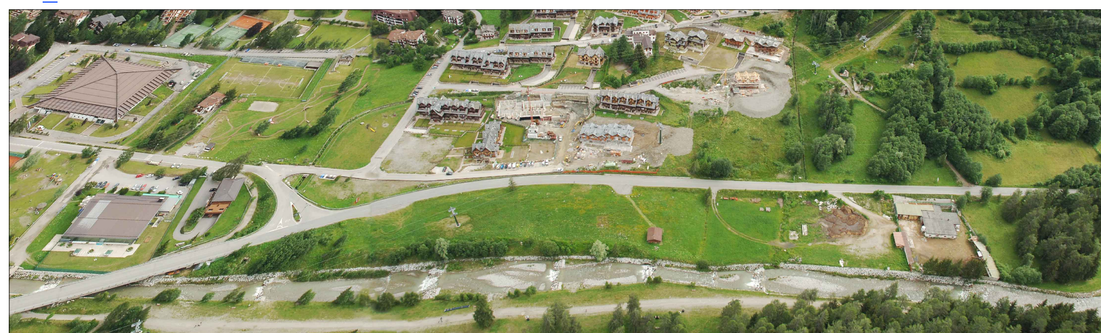
05_ vista dall'elicottero