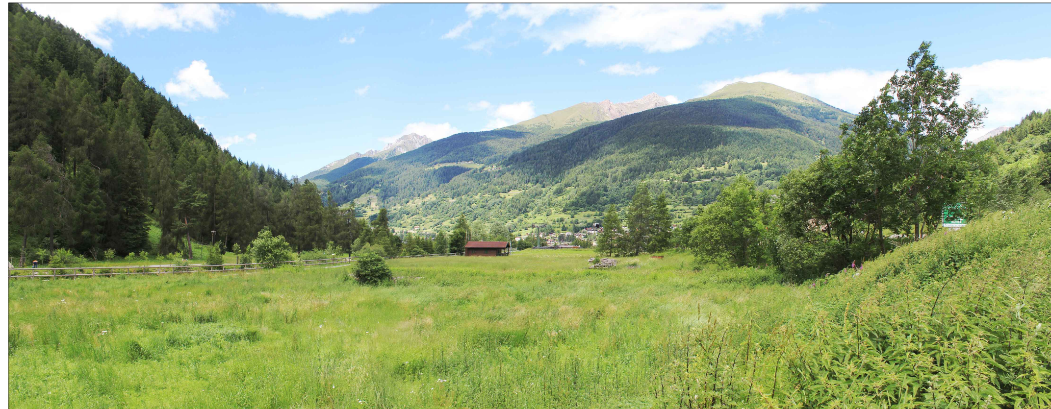
02_ vista dal centro dell'AdT_6