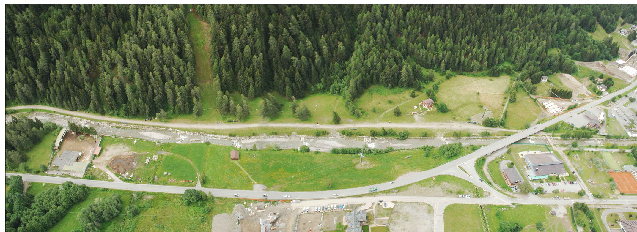
04_ vista dall'elicottero