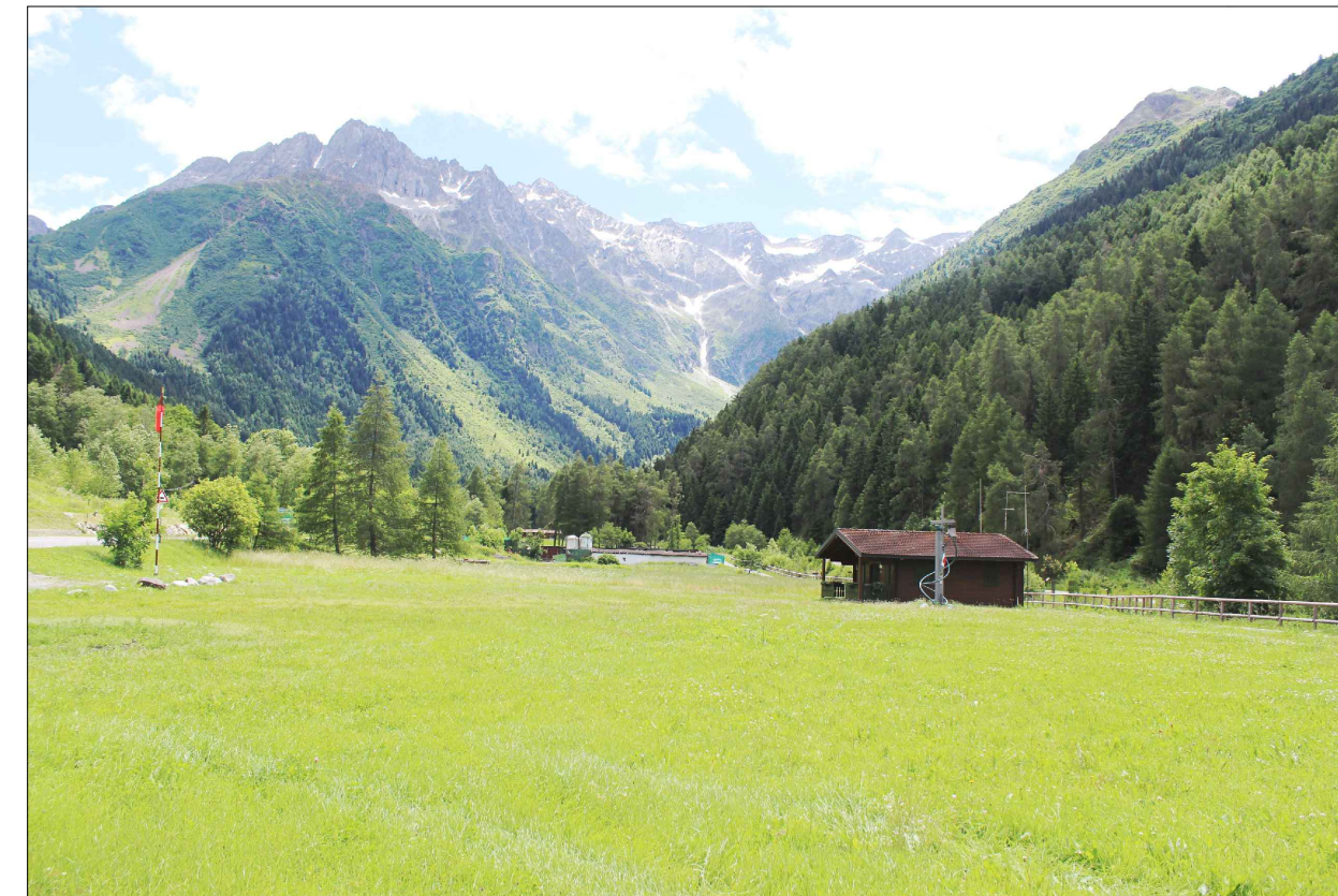
07_ vista dal centro dell'AdT_6