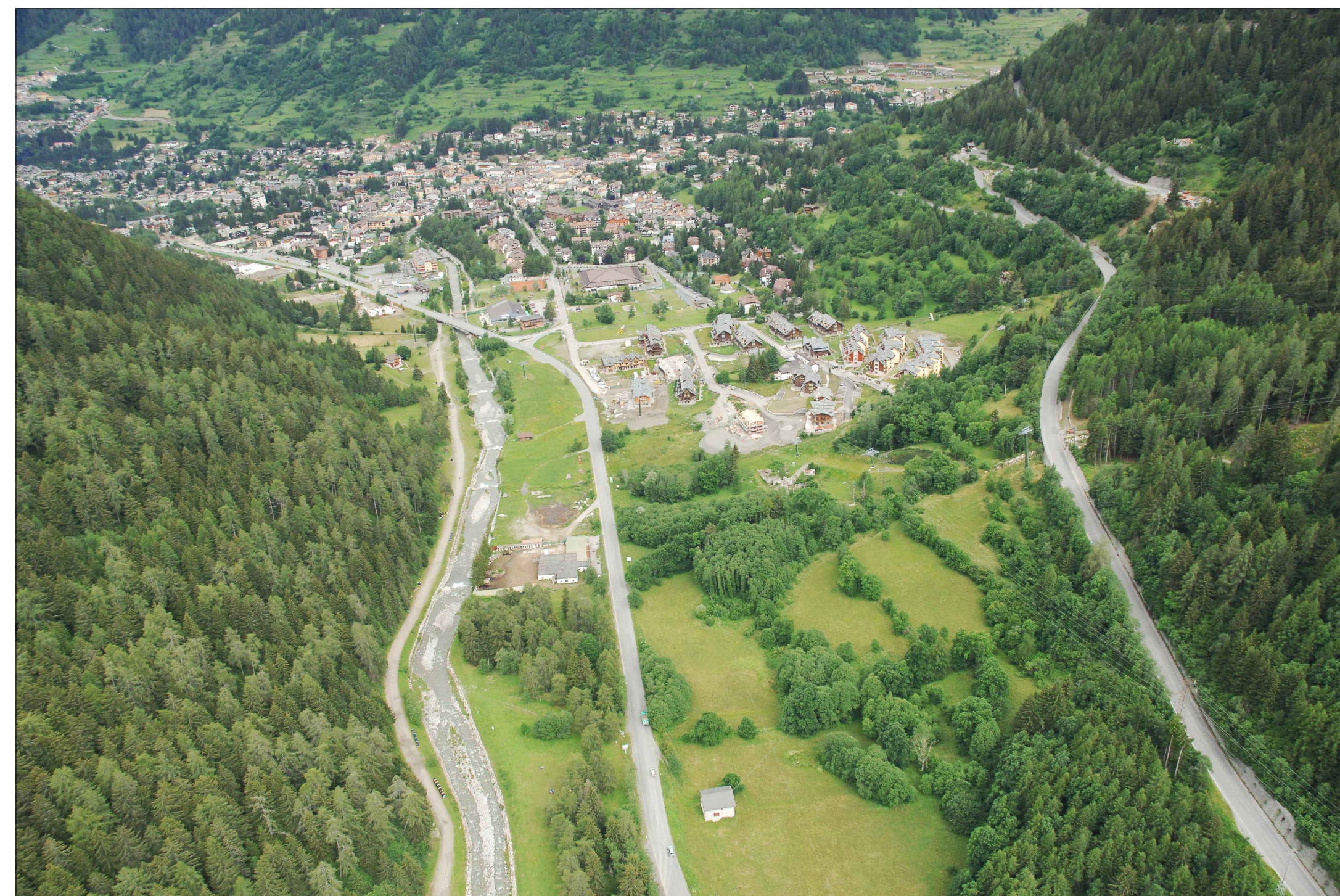
09_ vista dall'elicottero