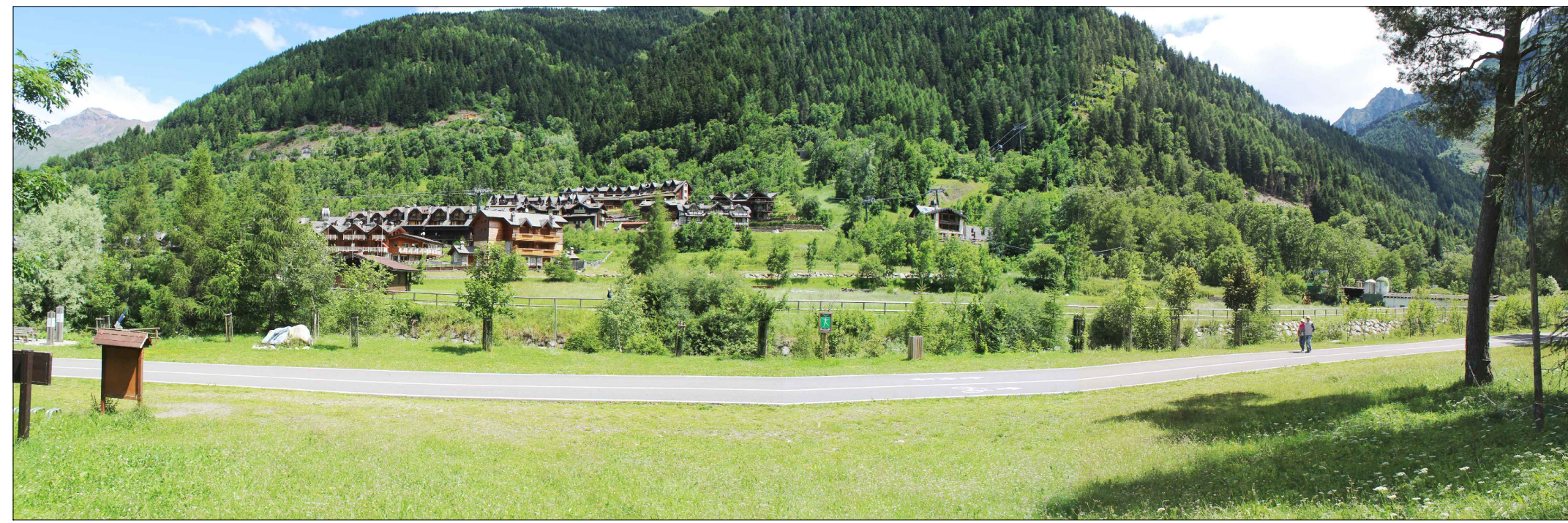
01_ vista dalla pista ciclopedonale