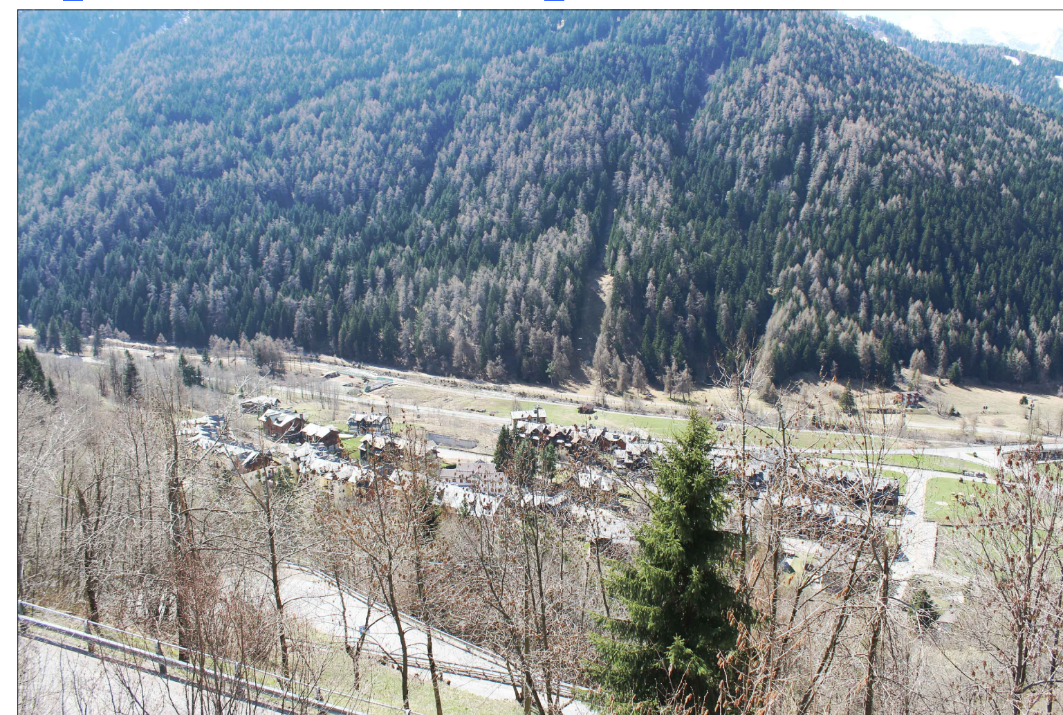
08_ vista dalla S.S. 42