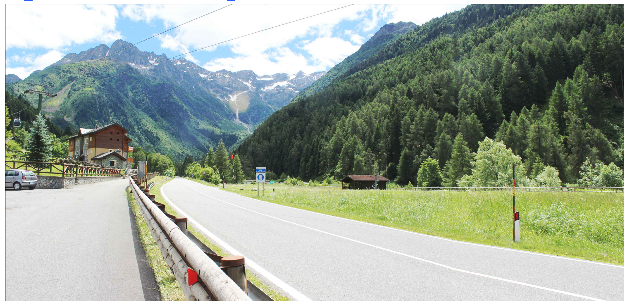
03_ vista dalla S.S. 42