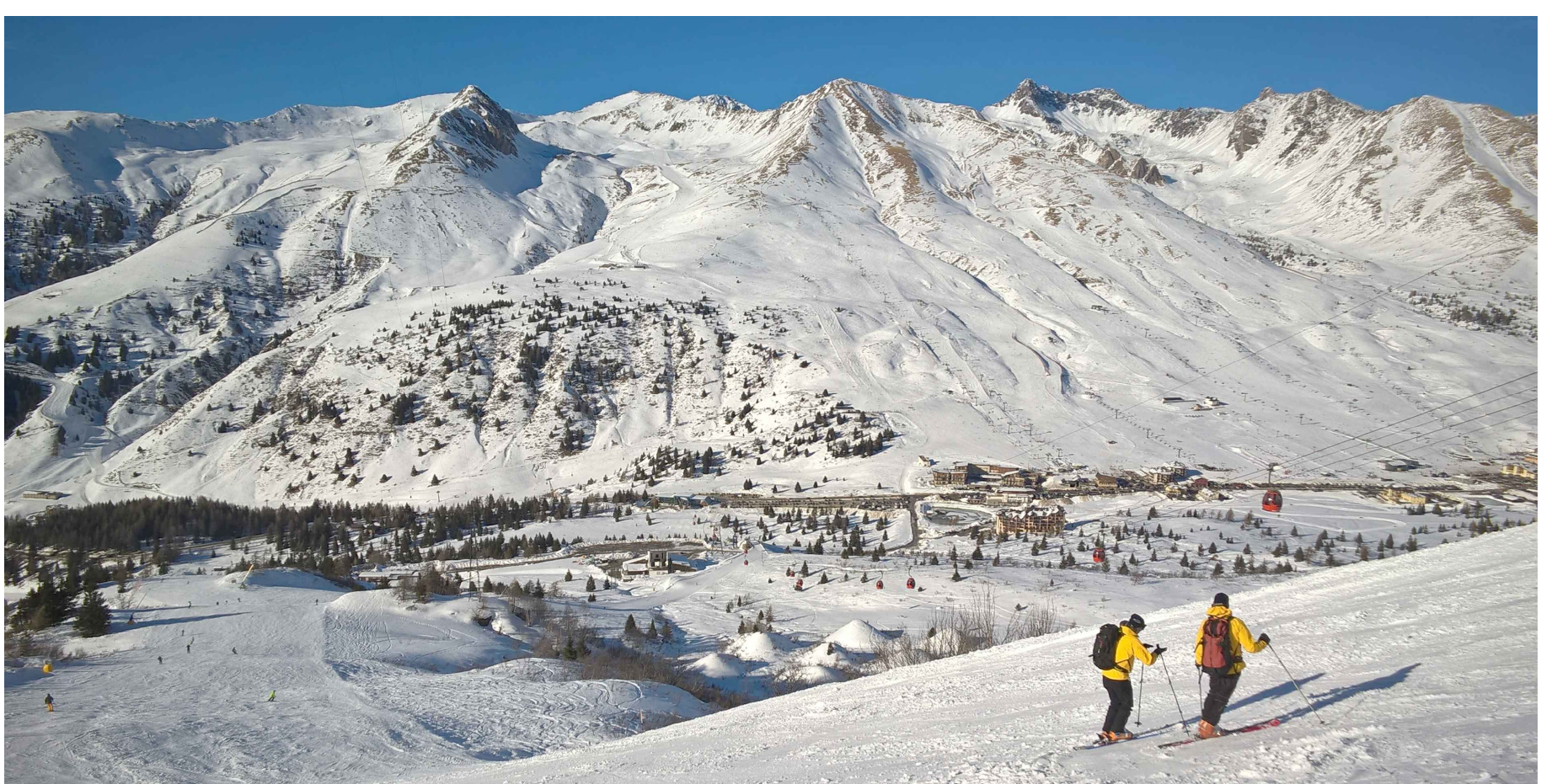
04_ vista da pista da sci "Paradiso"