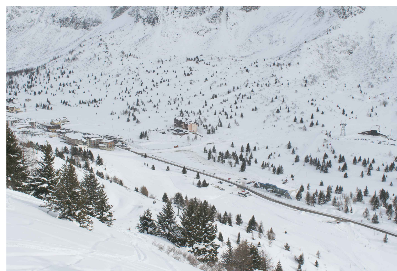
05_ vista da impianto di risalita "Negritella"