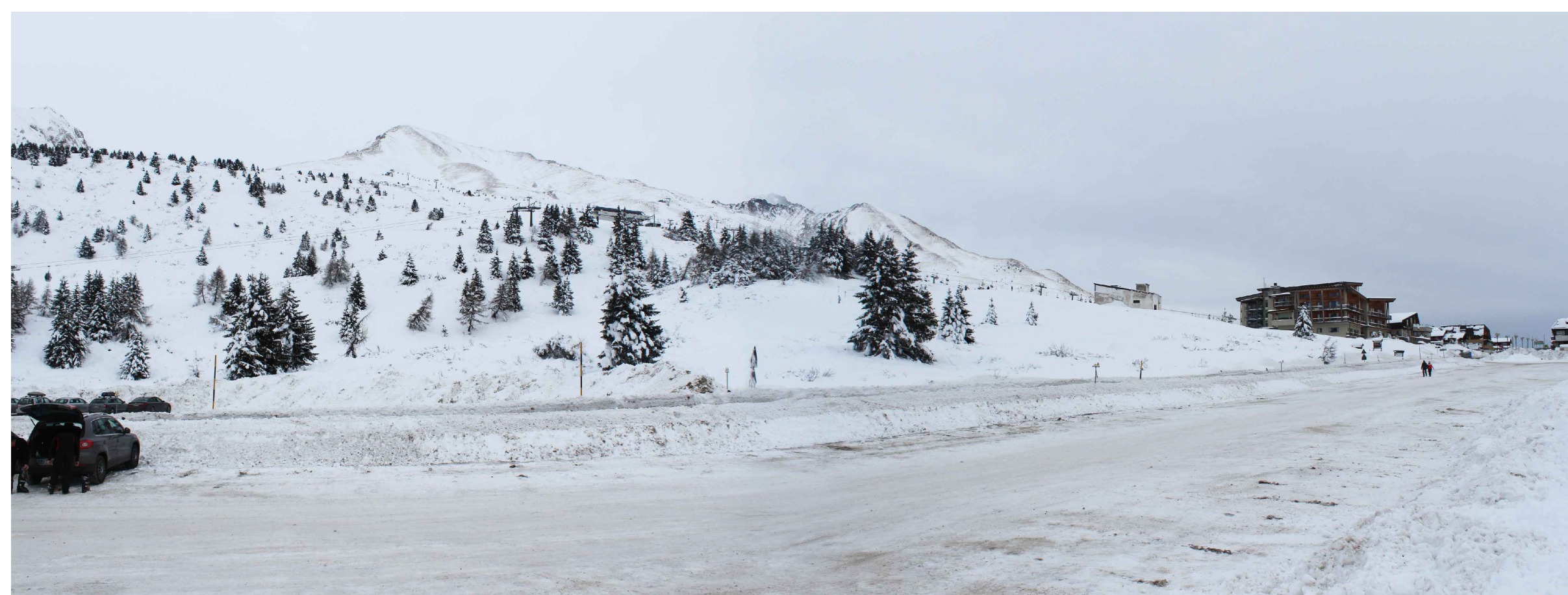
02_ vista da parcheggio impianto di risalita "Paradiso"