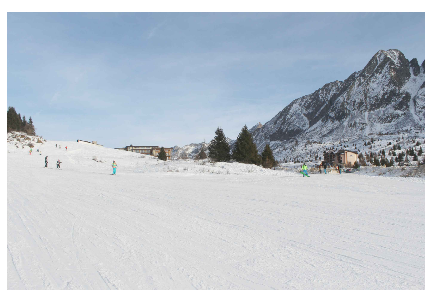
06_ vista da pista da sci "Tonalina"