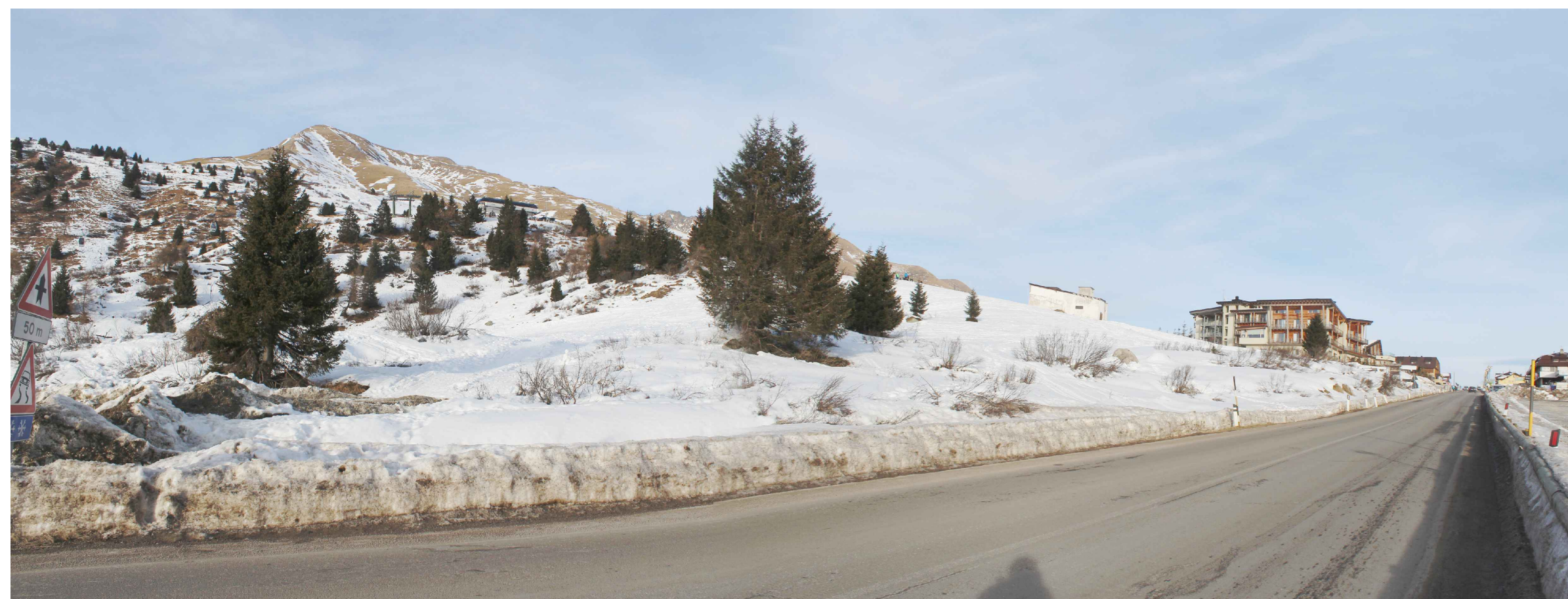
01_ vista da S.S. 42 direzione Tonale