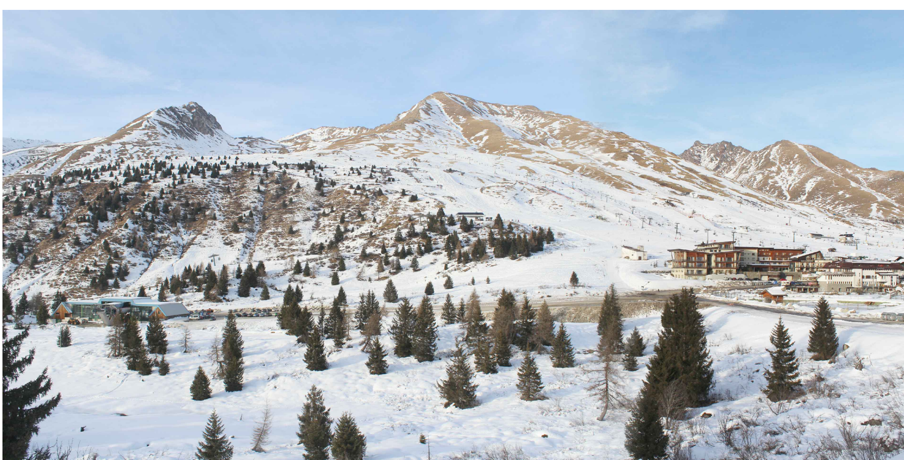
03_ vista da strada verso "Paradiso"