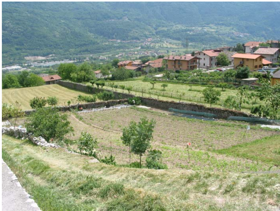
6. Visuale di Ono San Pietro: sulla sinistra San Pietro con la chiesa.