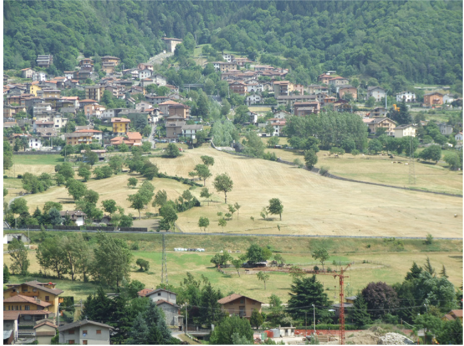
versante a valle dell'abitato di niardo - vista da losine

ambito ad elevato valore percettivo - allegato I NTA PTCP