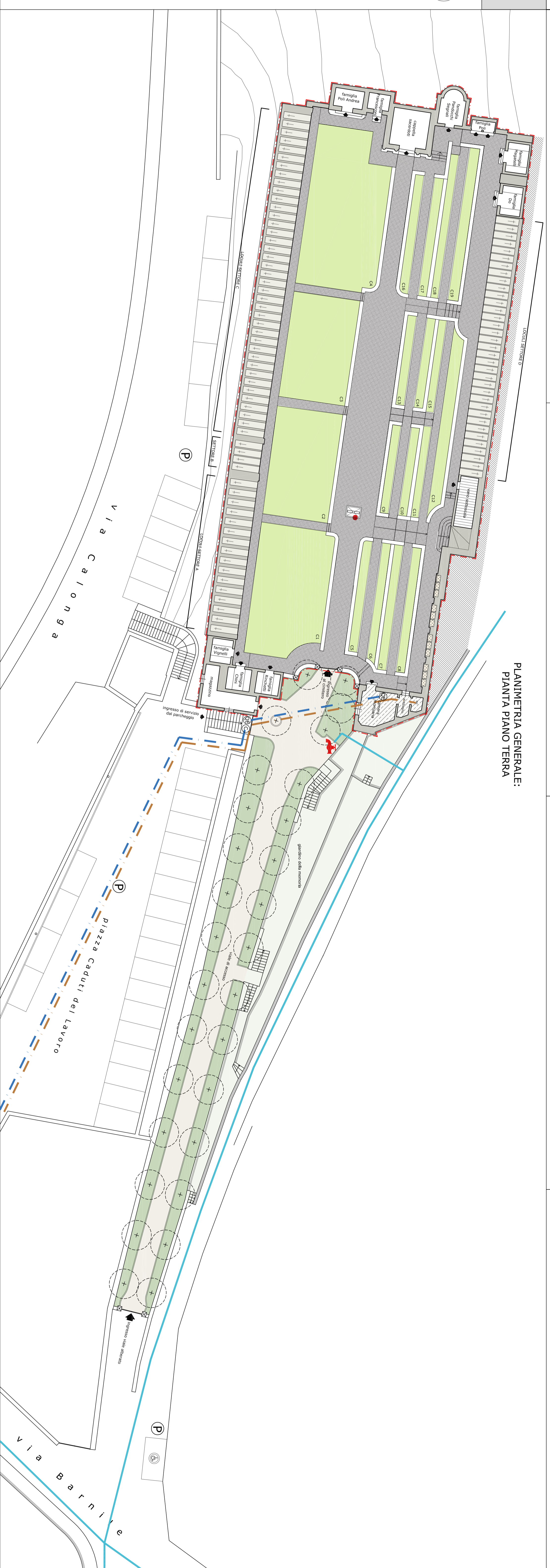
PLANIMETRIA GENERALE: PIANTA PIANO TERRA