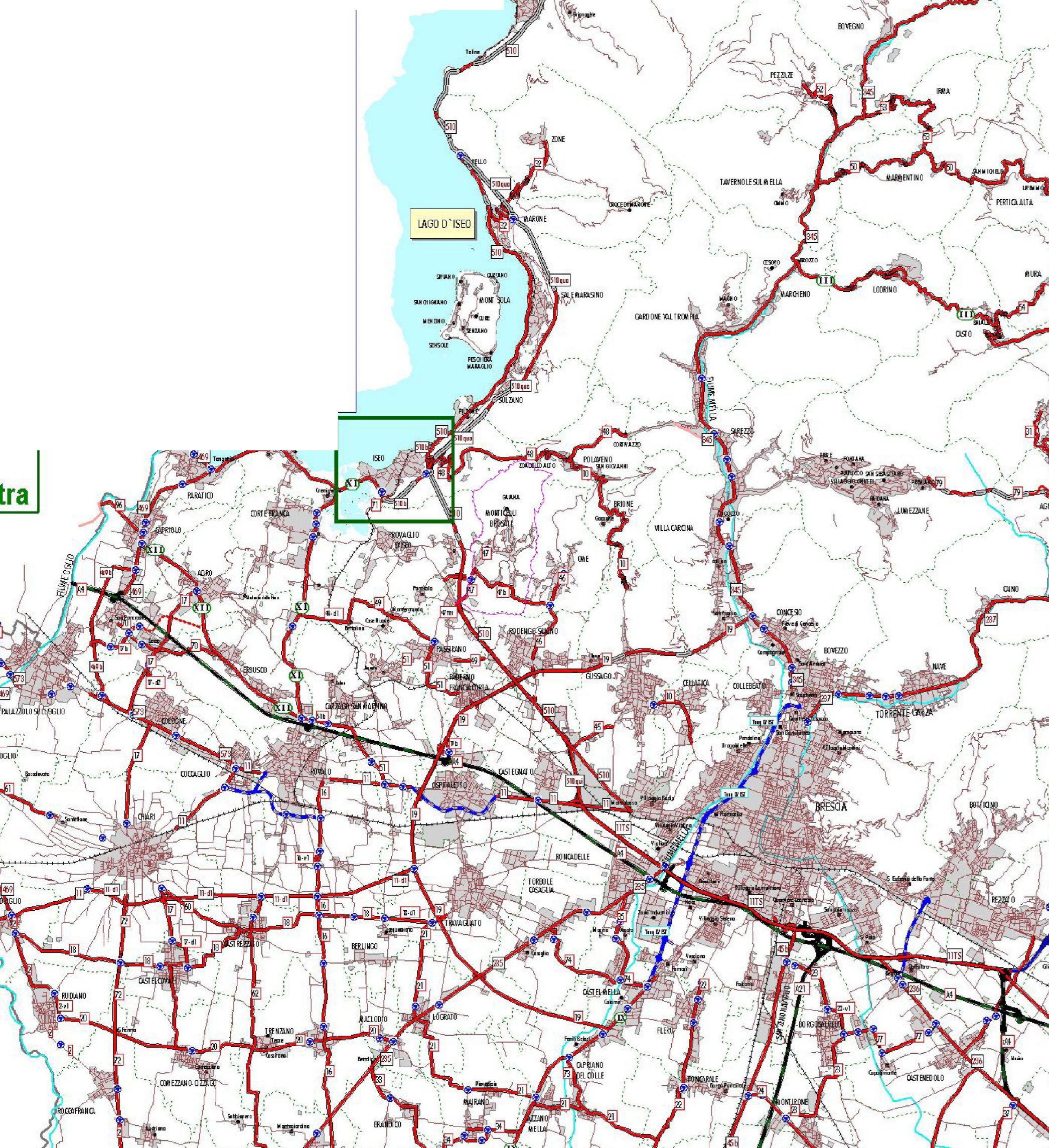
Classificazione amministrativa della rete stradale