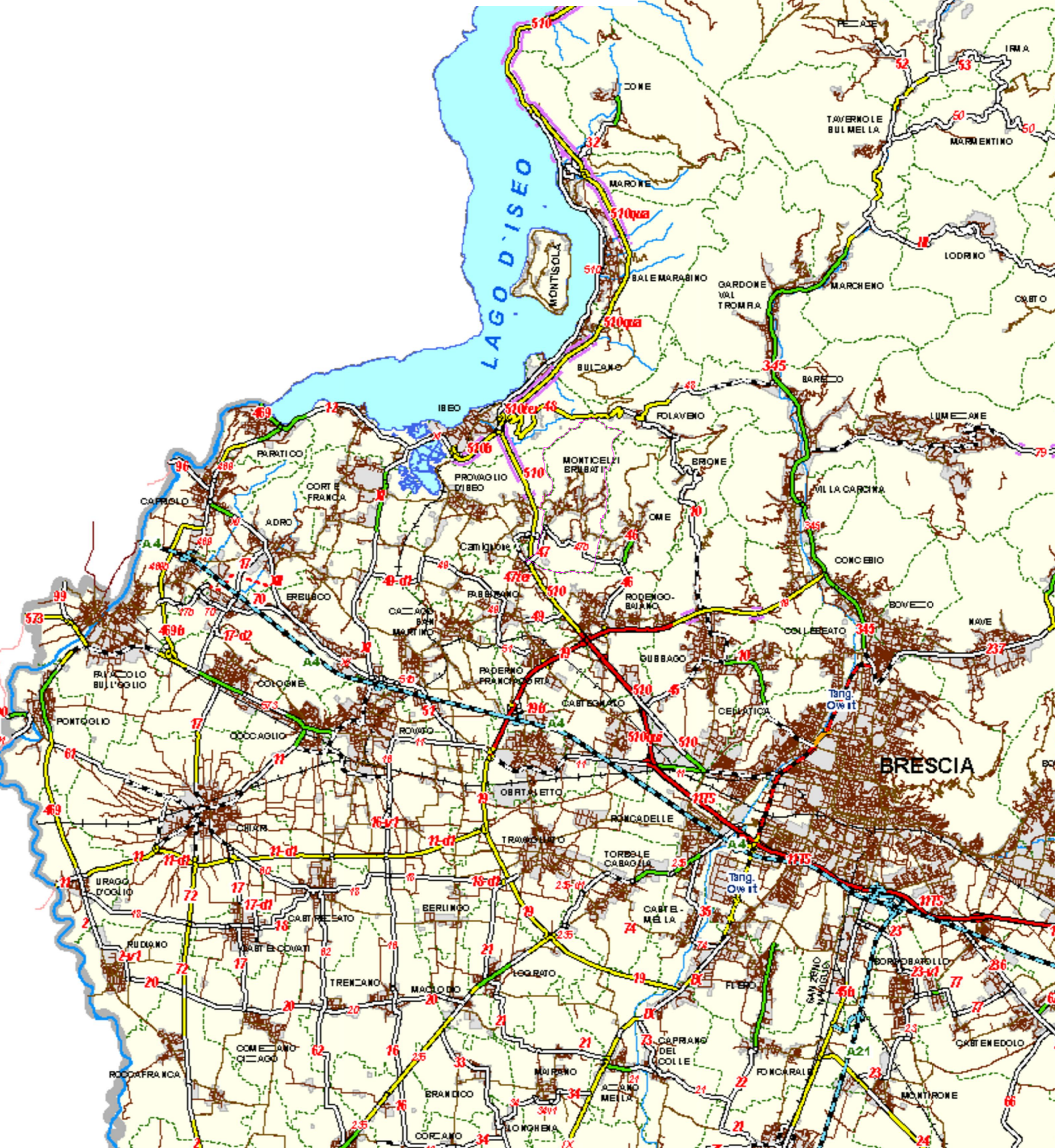
Classificazione tecnico funzionale della rete stradale esistente