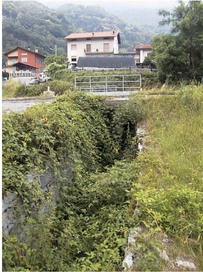
Foto 8: tombotto in corrispondenza dell'attraversamento della SS 42