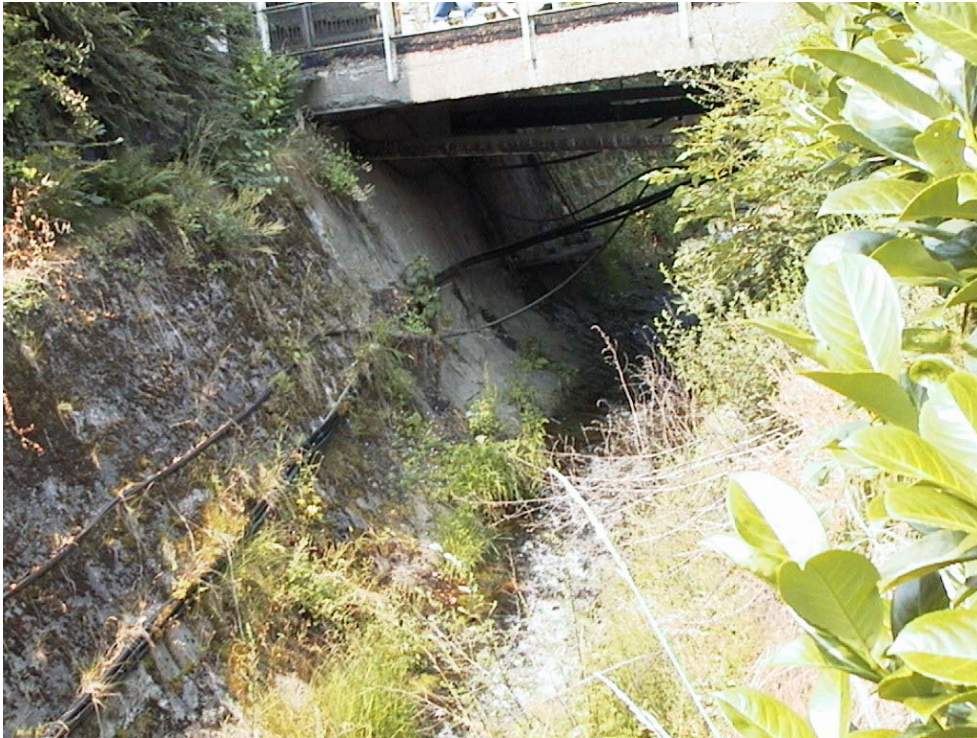
Foto 4: sezione 4, tratto di alveo regimato a valle del tombotto n°3