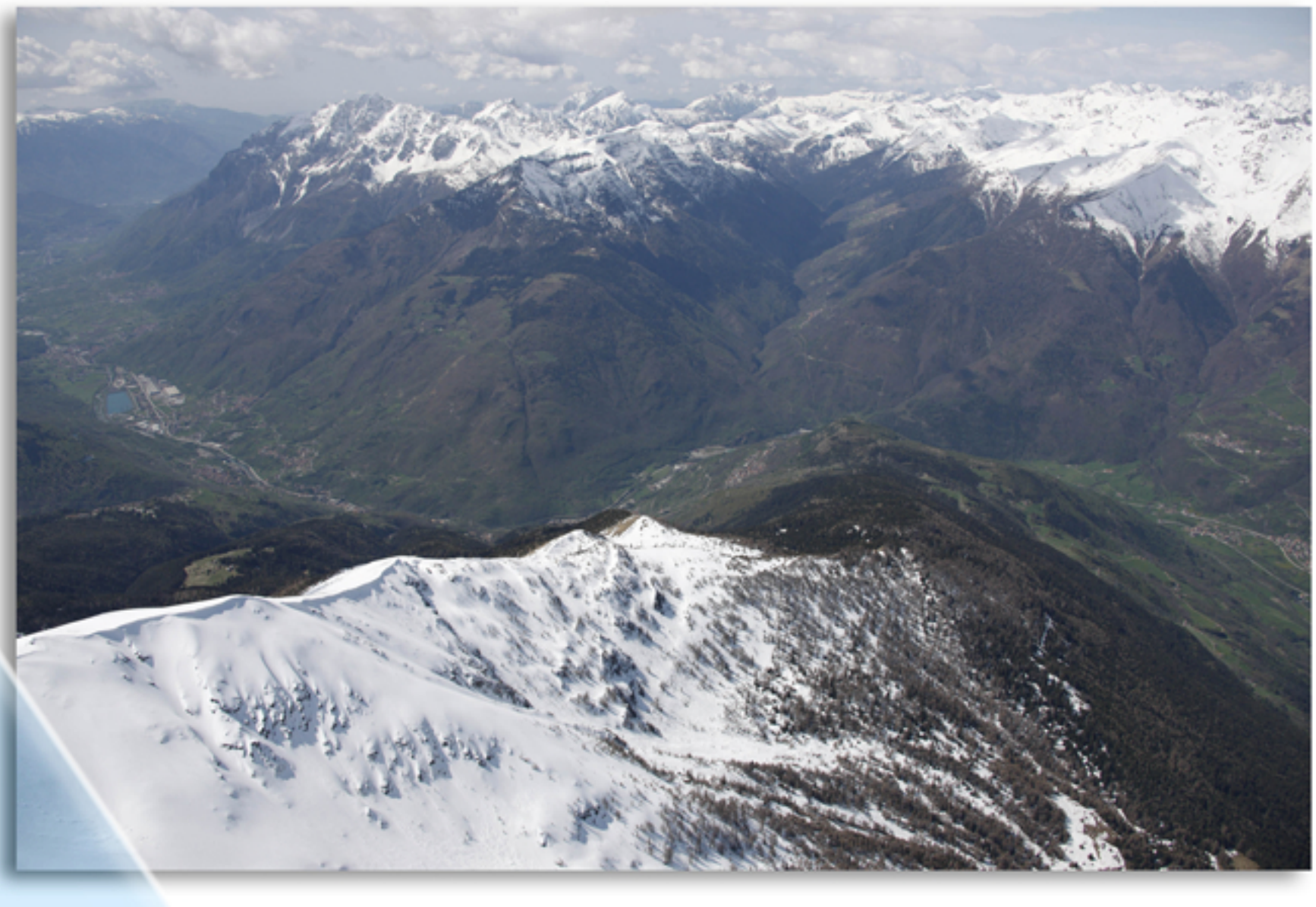
VISTE AEREE VERSO SUD