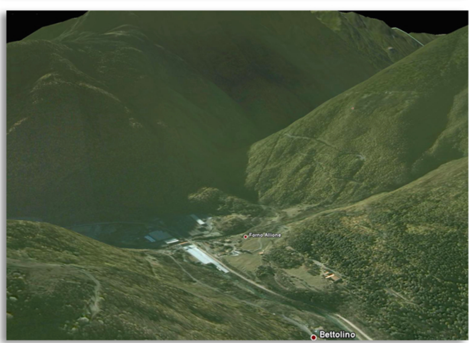
VISTE SATELLITARI data acquisizioni immagini da satellite: 13 novembre 2006