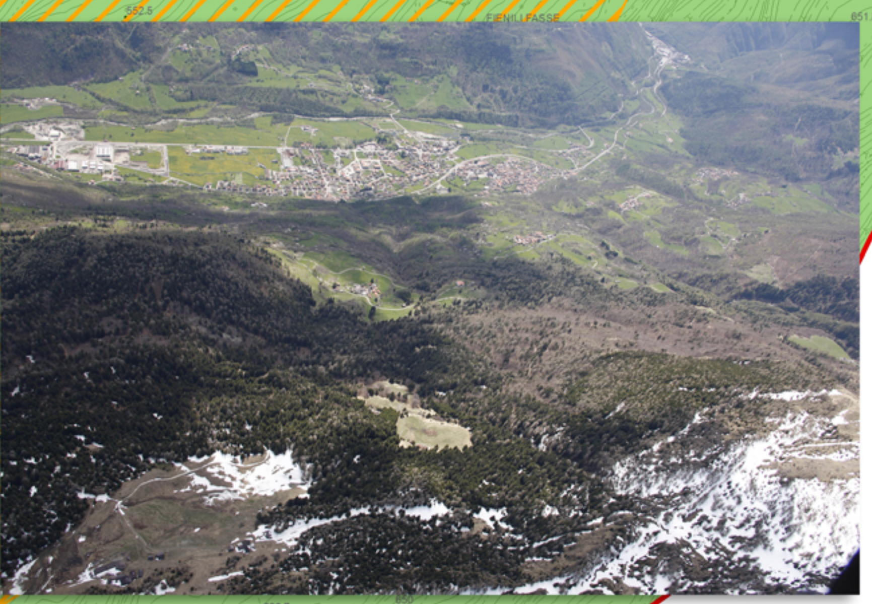
VISTE AEREE MALONNO