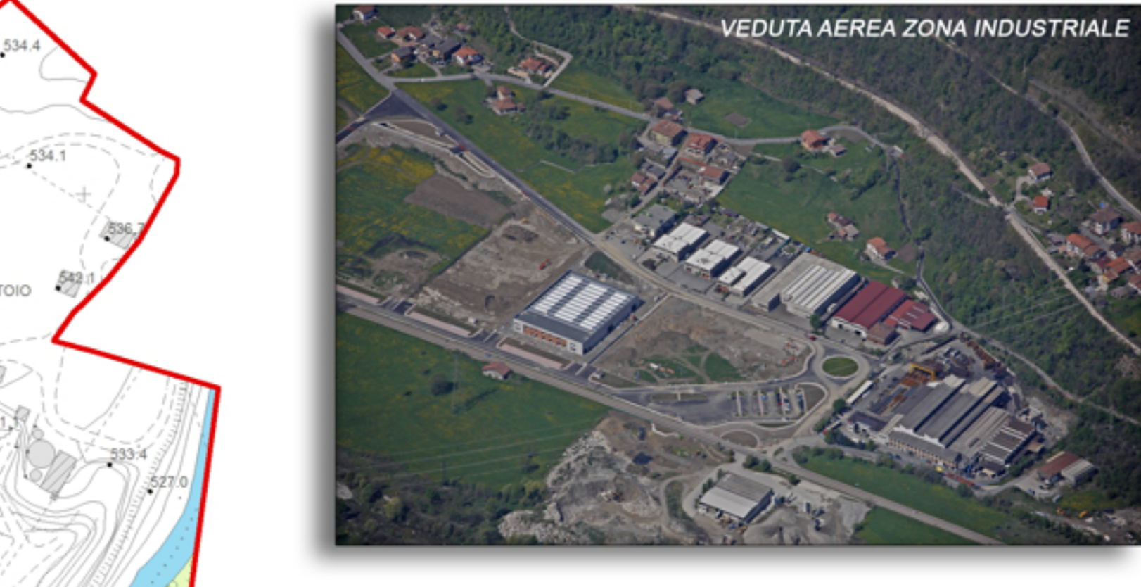
VEDUTA AEREA ZONA INDUSTRIALE