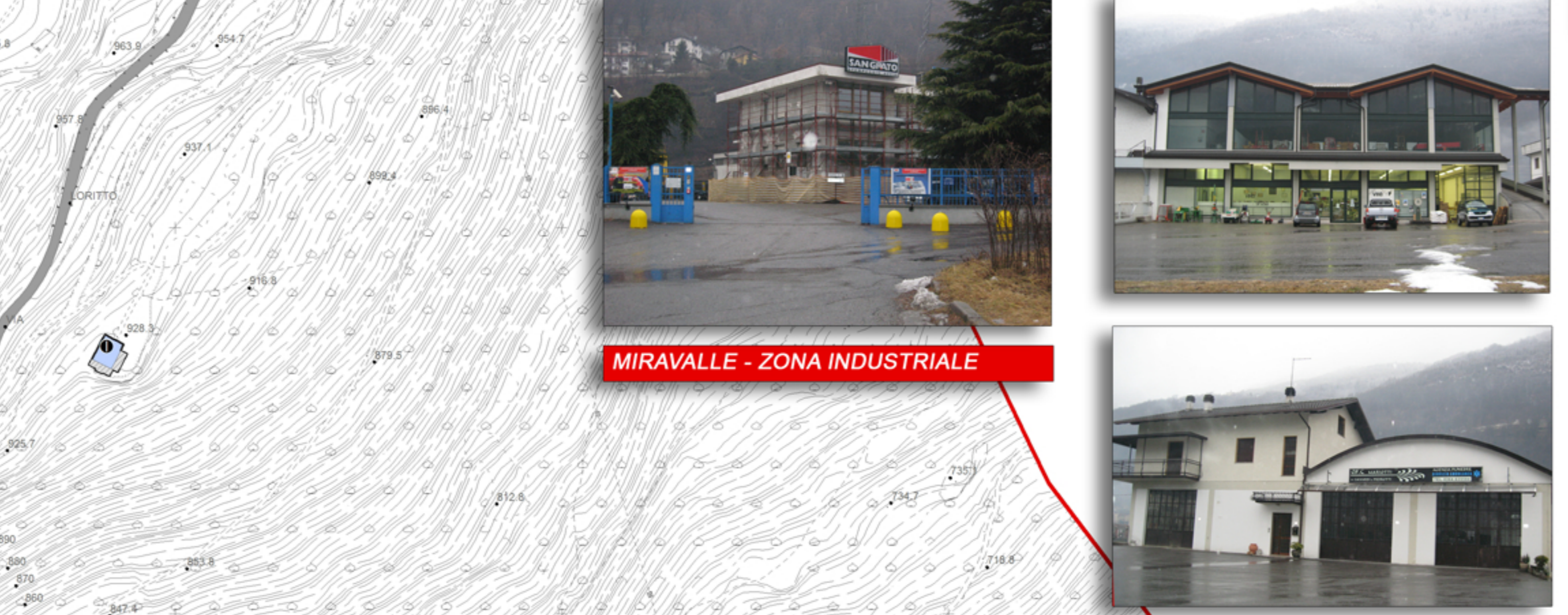
MIRAVALLE - ZONA INDUSTRIALE