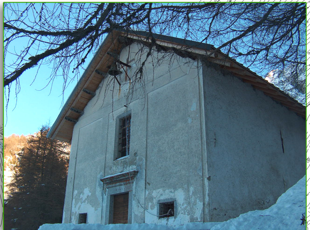
VISTE SANTUARIO S. VITO - S. ANNA