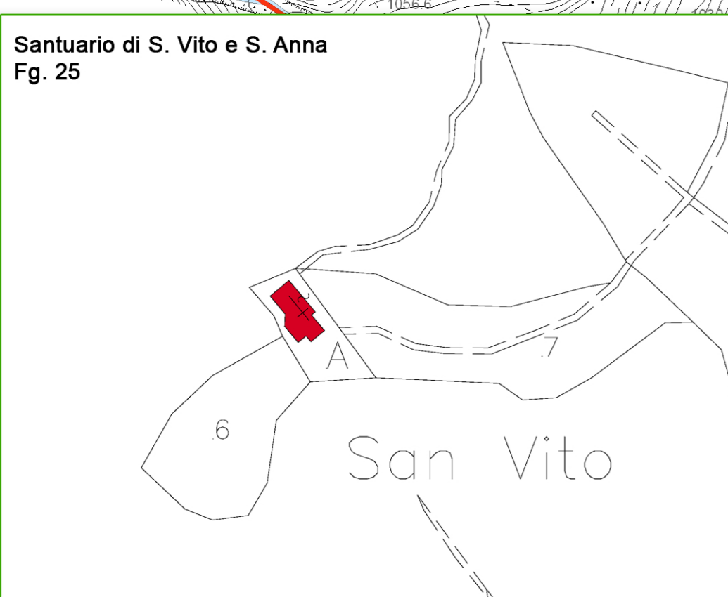
Santuario di S. Vito e S. Anna Fig. 25