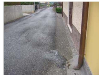
foto n.1 ERRATO SMALTIMENTO ACQUE METEORICHE