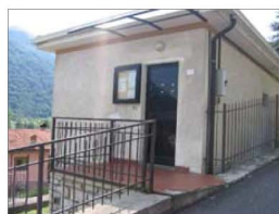
foto n. 1 AMBULATORIO MEDICO