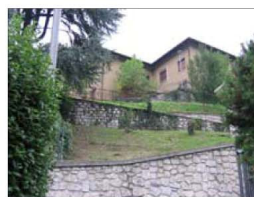
foto n. 3 SCUOLA ELEMENTARE ENDINE MARTIRI