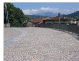
foto n. 4 PARCHEGGIO SENZA LIMITI DI SOSTA