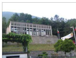
foto n. 2 MUNICIPIO E BIBLIOTECA