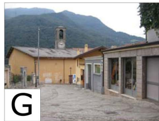
PERCORSO PEDONALE DA S.S. 42 A VIA S. GIORGIO: