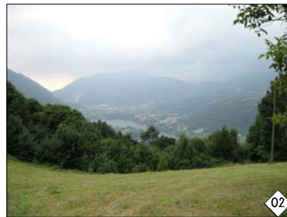
panoramica sul Lago d'Endine da Le Piane