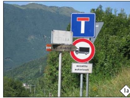
accesso da Monasterolo