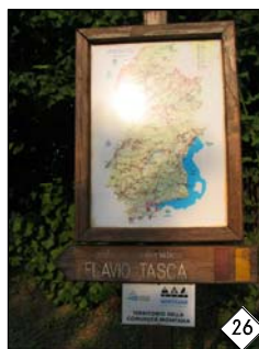
particolare segnaletica Sentiero Flavio Tasca