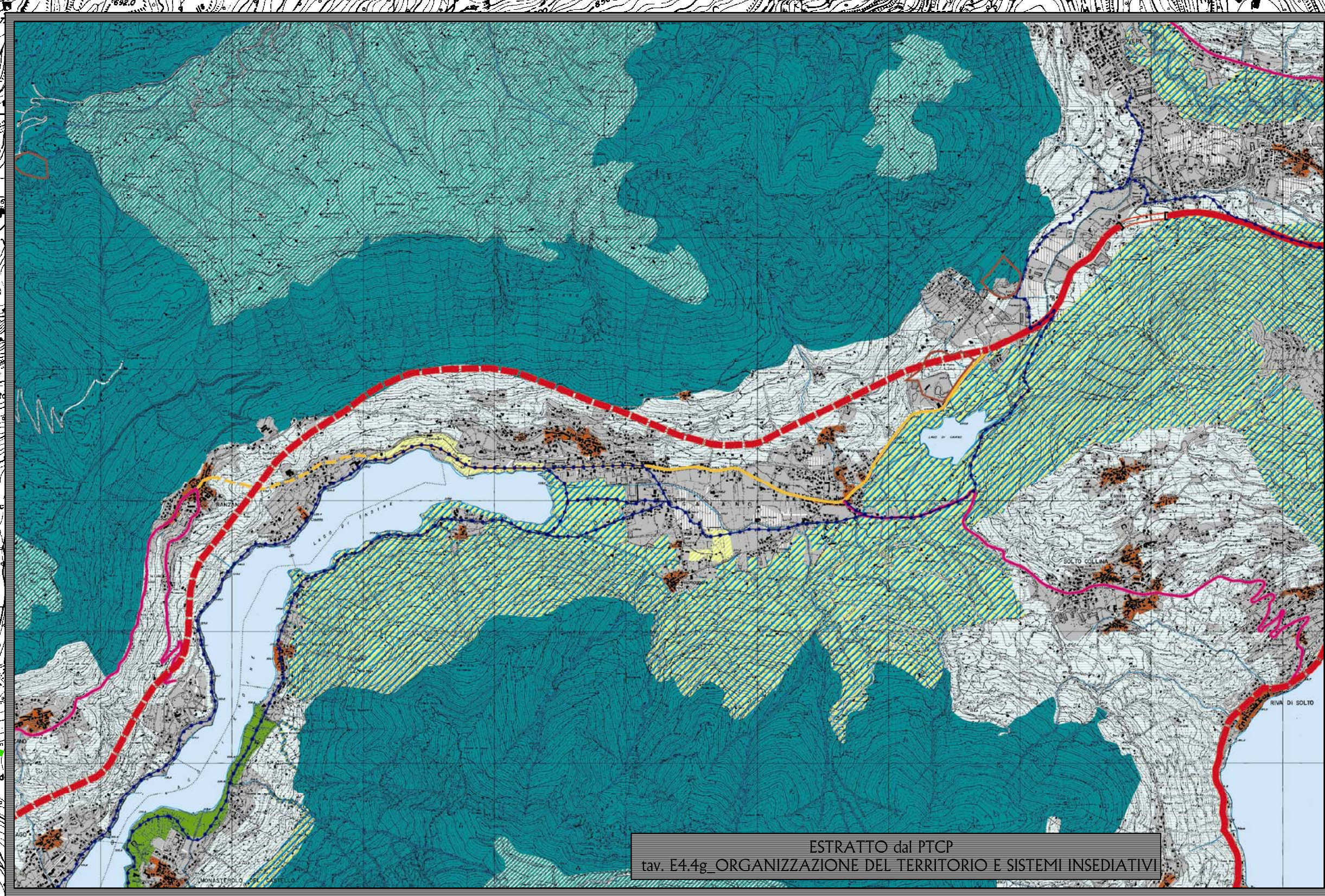
ESTRATTO dal P.T.C. tav. E4.4g ORGANIZZAZIONE DEL TERRITORIO E SISTEMI INSEDIATIVI