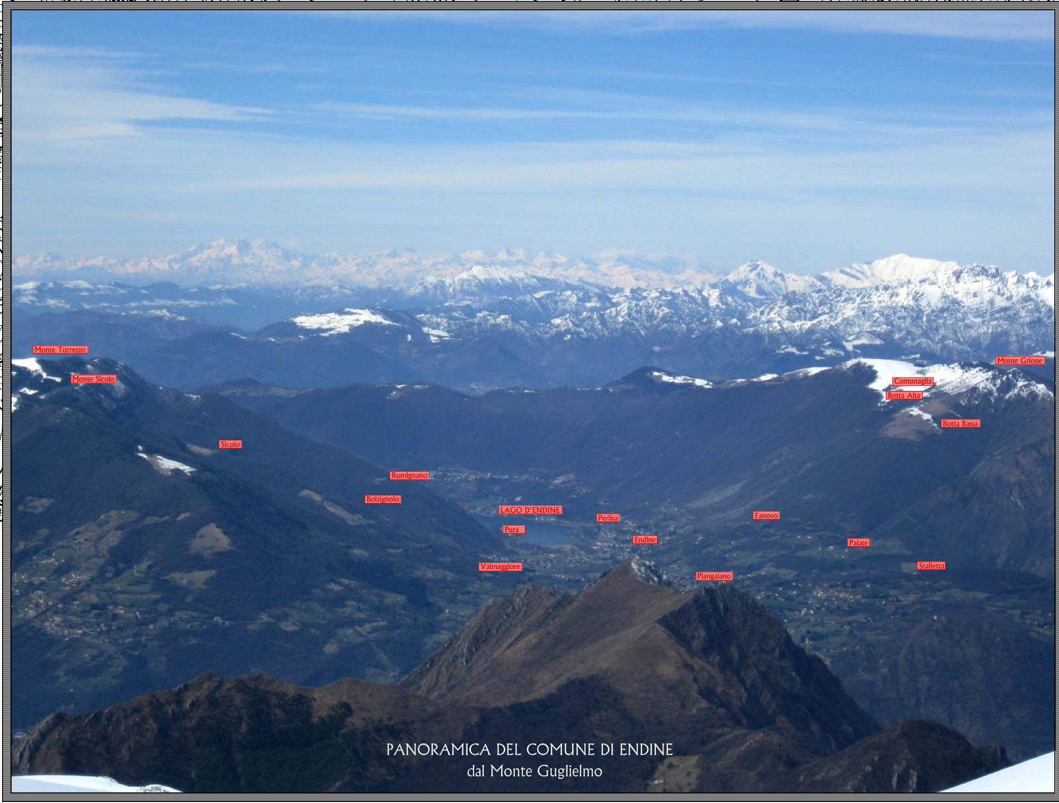
PANORAMICA DEL COMUNE DI ENDINE GAIANO dal Monte Guglielmo