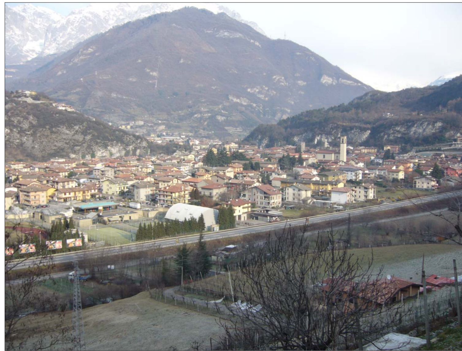
strada di versante Civitate Camuno - Berzo Inferiore media visualità

25040 esine (bs) - via a. manzoni 57 - tel. e fax 0364.46394