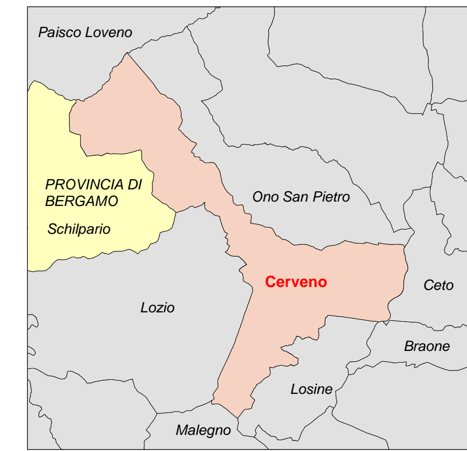
INDICAZIONI OPERATIVE su ortofoto scala 1:30.000