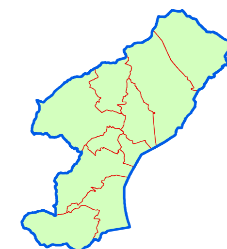
TAVOLA N. 7.b CARTA DELL'ATTITUDINE NATURALISTICA

COMUNI DI BOSSICO, CASTRO, COSTA VOLPINO, FONTENO, LOVERE, PIANICO, RIVA DI SOLTO, ROGNO, SOLTO COLLINA E SOVERE