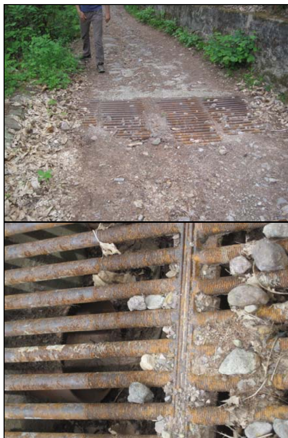
FOTO 7 e 8 RIM LOCALITA' GUALE