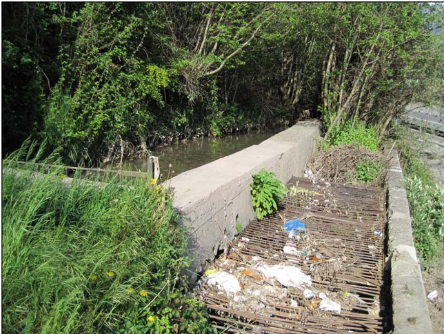
VASO RE NEI PRESSI DEL CONFINE CON ESINE