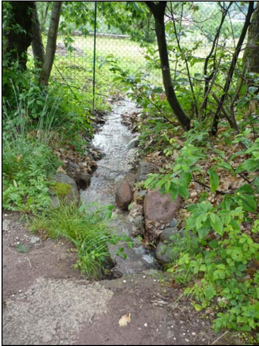
FOTO 1 - RETICOLO SECONDARIO