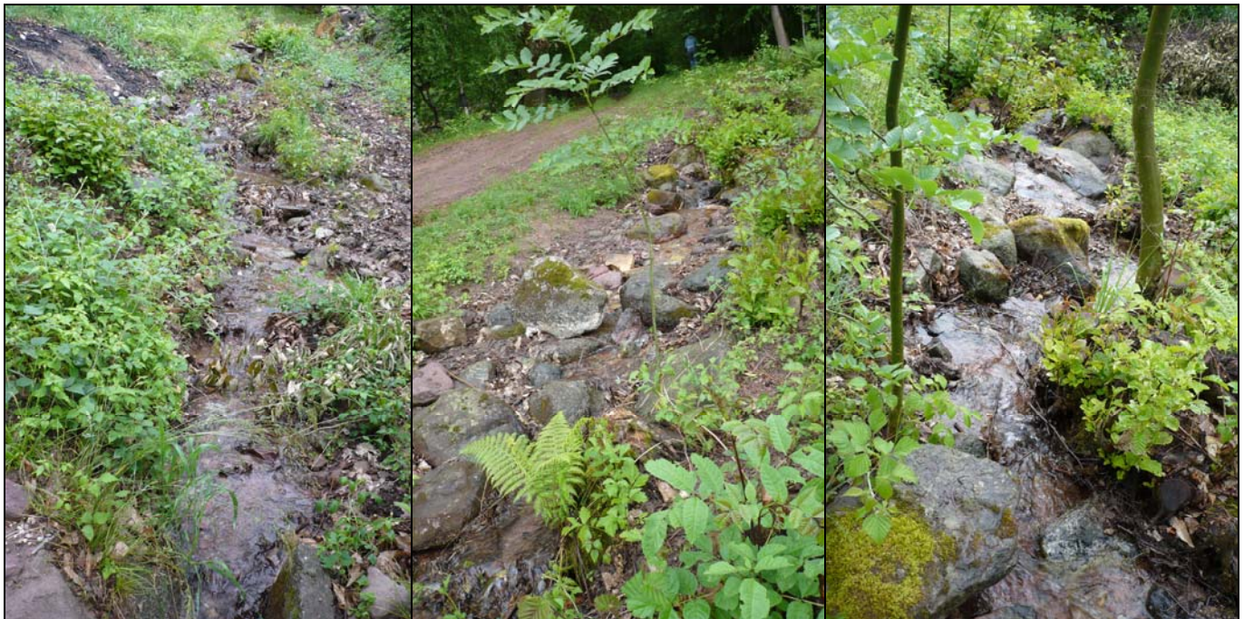
FOTO 3 - RETICOLO SECONDARIO