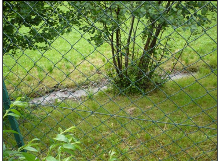
FOTO 2 - RETICOLO SECONDARIO