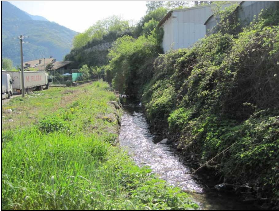
VASO RE IN CORRISPONDENZA DEL PARCHEGGIO TRE VALLI ACCIAI