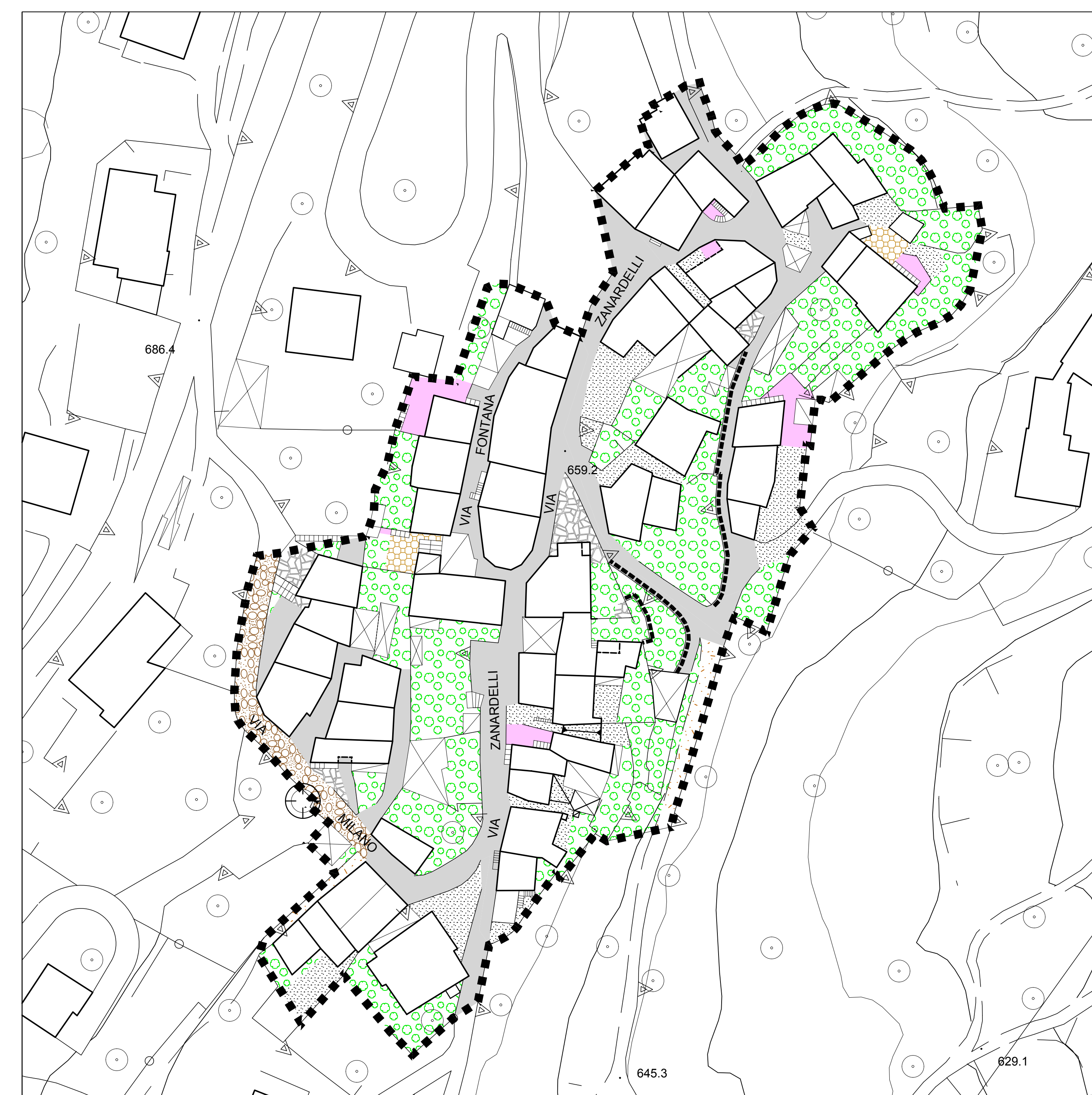
anfurro di sotto